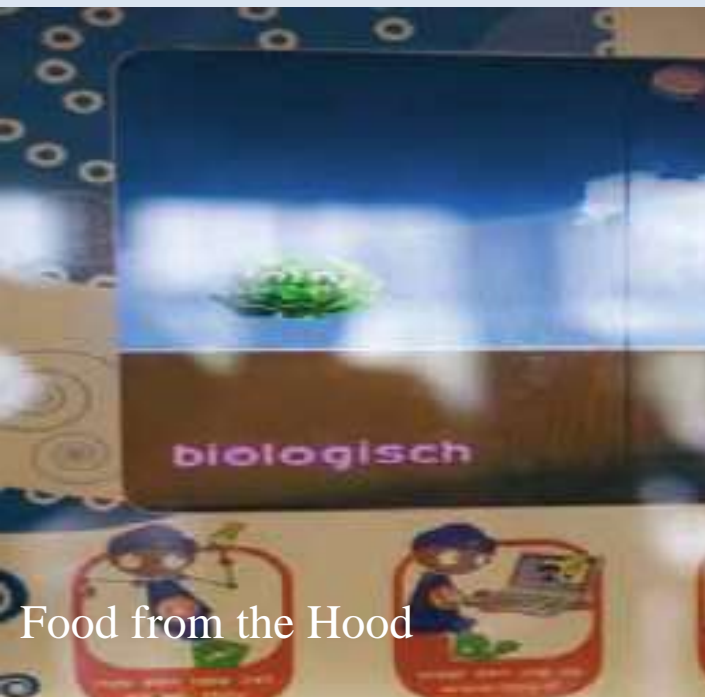
Food from the Hood